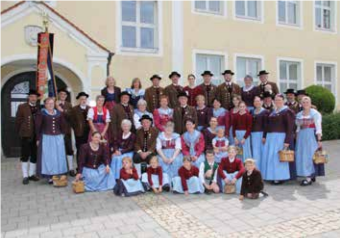
Mitglieder des Heimat- und Trachtenvereins in ihrer aktuellen Tracht.

Am Sonntag, den 28. Juli , feiern wir unser 100-jähriges Gründungsfest mit dem Donaugau-Trachtenfest.