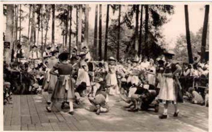
Das erste von vielen legendären Waldfesten, die der Trachtenverein ins Leben gerufen hatte, fand 1950 in der Bürgerau statt.

Reichertshofen - Der Trachtenverein „D'Schloßbergler“ Reichertshofen erreicht dieses Jahr einen bedeutenden Meilenstein und feiert sein 100-jähriges Bestehen. Dieses besondere Ereignis wird mit einem großen Gründungsfest am Paarfest-Sonntag, dem 28. Juli 2024, im Festzelt begangen. Zu den Feierlichkeiten gehören ein Gottesdienst und ein Festumzug, in Verbindung mit dem Donaugau-Trachtenfest. Im Laufe des letzten Jahrhunderts hat sich vieles gewandelt, doch die Kernaufgabe des Vereins ist unverändert geblieben: die Bewahrung von Kultur, Tradition und Brauchtum.