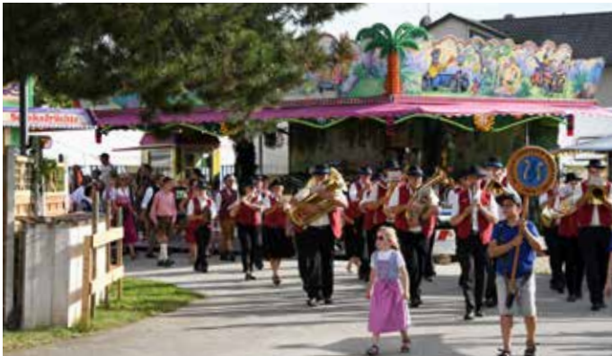
Einzug auf dem Paarfest mit den Musikanten