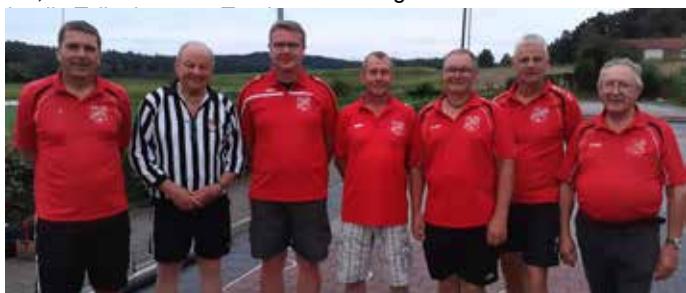
Nachmittagssieger SpVGG Langenbruck