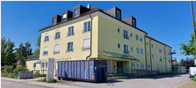
Wie geht es weiter mit der ehemaligen Seniorenresidenz (Foto)? Diese Fragen und viele mehr brachten die Bürger in der Bürgerversammlung vor den Rathauschef.

Ein weiterer Fragesteller forderte, die Paartaler Sanddünen dürften nicht mit Freiflächen-Photovoltaik „verschandelt“ werden. Franken antwortete, dass der Gemeinderat nicht darüber beschließe, sondern die Untere Naturschutzbehörde des Landkreises. „Das Gelände ist im Privatbesitz“, stellte der Bürgermeister klar. Gleiches traf auch auf einen weiteren Bürgerwunsch zu: für Freiflächen-Photovoltaik über Supermarkt-Parkplätzen. Auch hier habe die Gemeinde keine Handhabe. vov