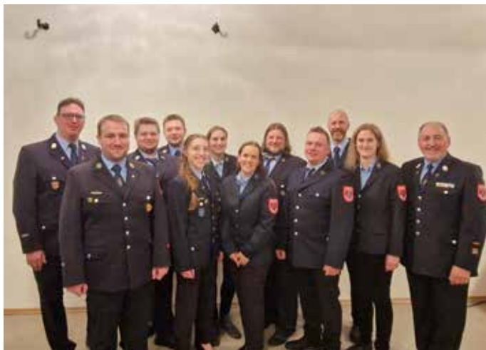
Das neue Vorstandsteam der Windener Wehr.