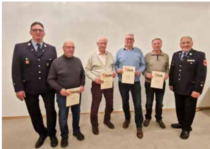
Zahlreiche langjährige Mitglieder konnten auf der letzten Jahreshauptversammlung der Windener Wehr geehrt werden.

satzberichte, Neuwahlen sowie Ehrungen und Ernennungen wurden durchgeführt.