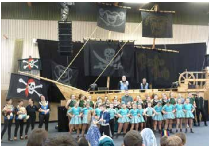
Am rußigen Freitag tanzte die Kinder- und Jugendgarde sowie das große Prinzenpaar der Faschingsgesellschaft REB in der Schule Reichertshofen

Am Rußigen Freitag tanzte die Kinder- und Jugendgarde sowie das große Prinzenpaar der Faschingsgesellschaft REB in der Turnhalle der Grund- und Mittelschule. Prinz Ben I und Prinzessin Diana I ließen es sich nicht nehmen, vor der tollen Piratenschiff-Kulisse, einigen Lehrkräften sowie Freunden einen Orden zu vergeben. Angefeuert von den 360 zum Teil maskierten Schülerinnen und Schülern zeigte die Garde ihr komplettes Programm. Mit tosendem Applaus wurden mehrfach Zugaben gefordert. Zum Schluss freuten sich die Kinder über den Süßigkeitenregen, als kleine Belohnung, den die Garde in die Menge warf.